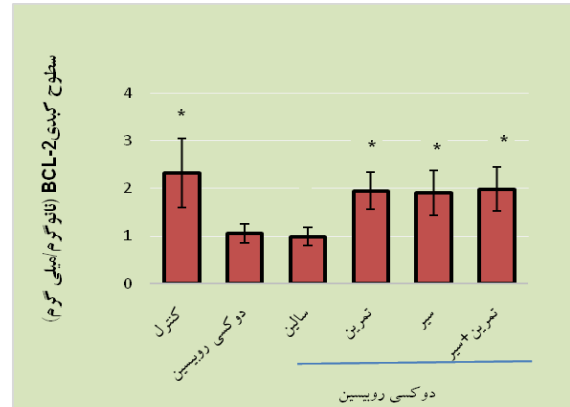
شکل ۱. مقایسه میانگین سطوح کبدی Bcl-2 در گروه‌های مختلف

تحقیق، در مقایسه با گروه کنترل پایین‌تر بود؛ ولی این تفاوت، معنی‌دار نبود ( P > 0/05 ). علاوه بر این، تفاوت معنی‌داری بین تأثیر سه مداخله فوق در افزایش سطوح کبدی Bcl-2 مشاهده نشد (شکل ۱).