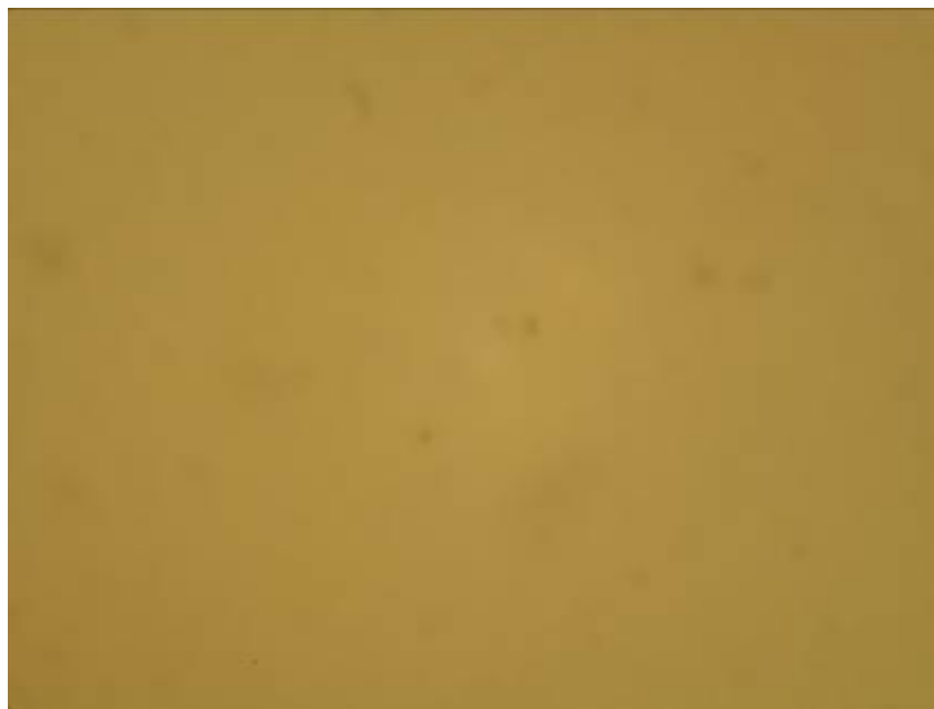
شکل ۵. رنگ آمیزی ایمنوهیستوشیمیایی جهت نمونه کنترل منفی است که حساسیت و دقت آنتی‌بادی را تأیید می‌کند. بزرگنمایی ۱۰۰۰

دو گروه مطالعه و کنترل محاسبه شد (جدول ۳). تحلیل آماری حاکی از اختلاف معنادار بین سلول‌های آستروسیت در گروه کنترل با گروه مطالعه در هفته چهارم است. تحلیل آماری حاکی از اختلاف معنادار بین سلول‌های الیگو دندروسیت در گروه کنترل با گروه مطالعه در هفته چهارم است. تحلیل آماری حاکی از اختلاف معنادار بین سلول‌های الیگو دندروسیت در گروه کنترل با گروه مطالعه در هفته چهارم است.