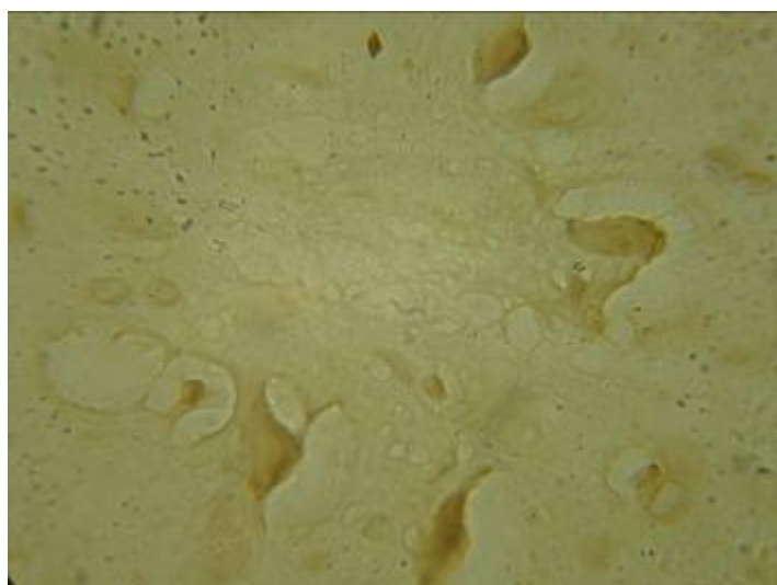
شکل ۳. مقطعی از بافت نخاع ناحیه آسیب دیده در رنگ آمیزی ایمنوهیستوشیمیایی جهت سلول های آستروسیت. در گروه مطالعه ۴ هفته پس از اعمال فشار مکانیکی. محل جسم سلولی و زوائد سلولی به رنگ قهوه ای مشخص است. بزرگ نمایی ۱۰۰۰