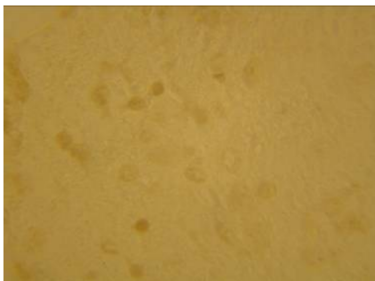
شکل ۴. مقطعی از بافت نخاع ناحیه آسیب دیده در رنگ آمیزی ایمنوهیستوشیمیایی سلول های الیگو دندروسیت در گروه مطالعه ۴ هفته پس از اعمال فشار مکانیکی. محل جسم سلولی به رنگ قهوه ای مشخص است. بزرگ نمایی ۱۰۰۰