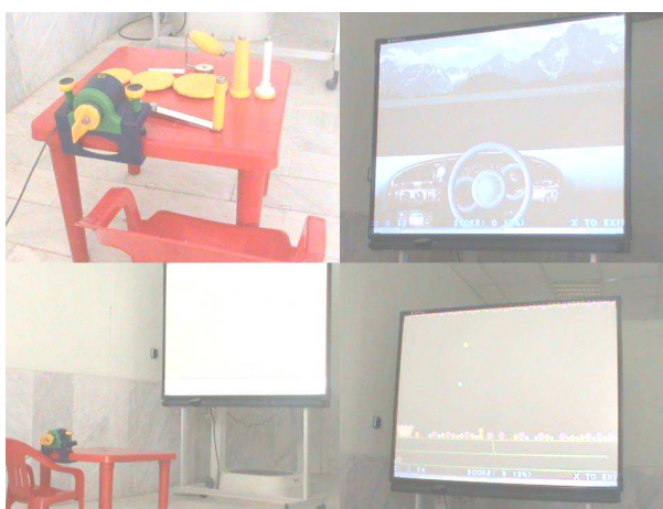
شکل ۱: سیستم واقعیت مجازی E-Link

کسب رضایت نامه کتبی، دو جلسه ارزیابی اولیه به فاصله ۱ هفته صورت گرفت. پس از دومین جلسه ارزیابی اولیه، کودکان به صورت تصادفی به ۲ گروه واقعیت مجازی و کنترل تقسیم شدند. تصادفی سازی