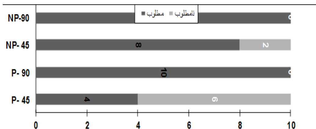
نمودار ۲. فراوانی شکست‌های مطلوب و نامطلوب