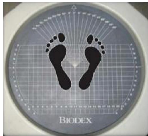
شکل ۱. محل قرارگیری پاها روی دستگاه بایودکس

در ادامه، برای اندازه‌گیری نوسان پاسجر آزمودنی‌ها از دستگاه تعادلی بایودکس استفاده شد. صفحه این دستگاه شامل نواحی چهارگانه برای استقرار پنجه پای راست در ربع اول، پنجه پای چپ در ربع دوم، پاشنه پای چپ در ربع سوم و پاشنه پای راست در ربع چهارم می‌باشد (شکل ۱). برای اندازه‌گیری نوسانات قامتی کل (Overall)، جانبی داخلی (ML) و همچنین قدامی خلفی (AP) از آزمون ثبات پاسجرال استفاده شد؛ به این ترتیب که بعد از توضیحات شفاهی درمورد دستگاه و نحوه انجام آزمون، هریک از آزمودنی‌ها با پای برهنه و با فاصله یک عرض شانه بین پاهایشان، روی دستگاه بایودکس قرار گرفتند و بعد از یک مرتبه اجرای آزمون و آشنایی با چگونگی اجرای آزمون ثبات پاسجرال، تست اصلی را اجرا نمودند. نتایج دستگاه بدین صورت تفسیر می‌شود که هرچه نمره تعادل پایین‌تر باشد دلیل بر تعادل بیشتر فرد است.