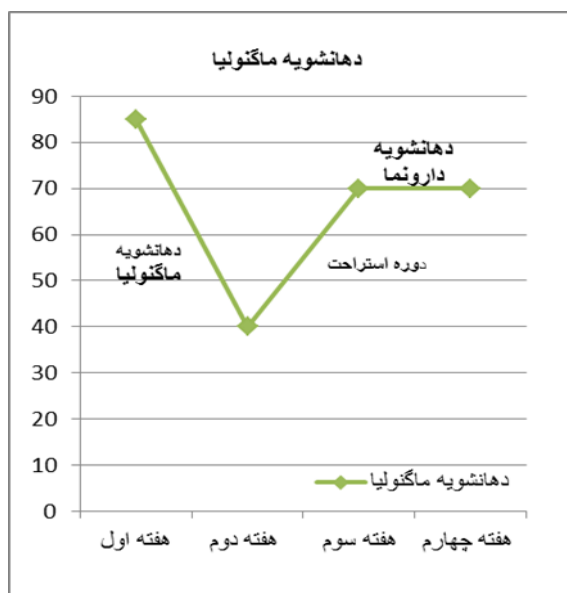
نمودار ۱. درصد پلاک ایندکس در افراد مصرف کننده دهانشویه ماگنولیا در نوبت اول