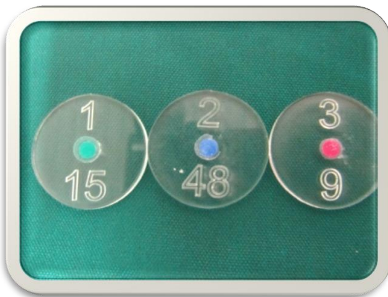
شکل ۱. شماره‌گذاری نمونه‌ها

ابتدا اسلب شیشه‌ای را روی یک سطح مسطح قراردادیم و قالب تهیه‌شده را روی آن نهادیم؛ سپس با تفنگ مخصوص، مقداری از کامپومر را درون قالب قرارداده، با کندانسور از یک طرف، پک کردن کامپومر را آغاز کردیم تا از حباب‌زدن توده کامپومر جلوگیری شود؛ هنگامی که قالب از کامپومر، پر شد، لام شیشه‌ای دیگری روی آن قرارداده، آن را پرس کردیم (برای جلوگیری از حباب‌زدن، اسلب از یک سمت به طرف سمت دیگر قرارداده شد)؛ سپس با توجه به گروه‌بندی نمونه‌ها هر یک از رنگ‌ها ۲۰، ۴۰ و ۶۰ ثانیه کیور شدند به طوری که نوک دستگاه لایت کیور (LED-DentAmerica) در تماس با